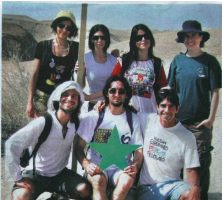
יותר חברות, כחות עניינים מדיניים. נוער האספרנטו העולמי מבקר בישראל