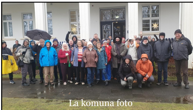
La komuna foto